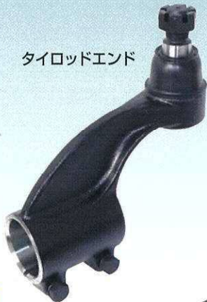
タイロッドエンド