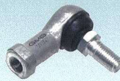
ギアシフトリンク ボールジョイント