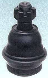
ボールジョイント