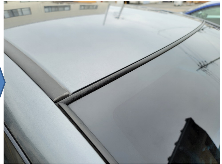
クリアウォッシャー液乾燥後