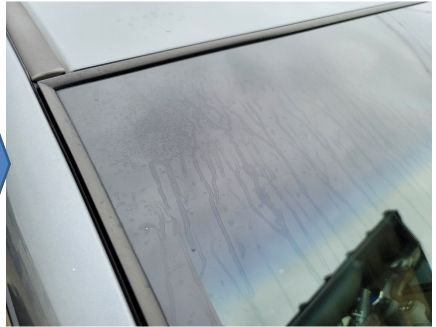
従来型ウォッシャー液乾燥後