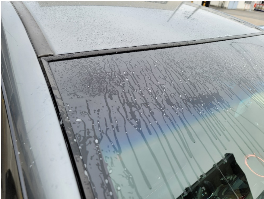
従来型ウォッシャー液噴射直後