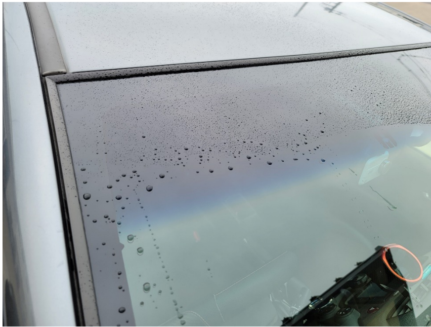
クリアウォッシャー液噴射直後